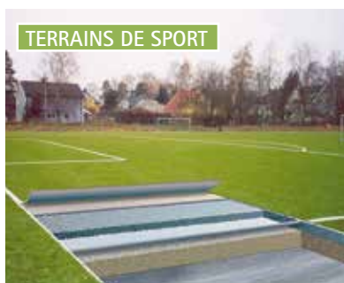
TERRAINS DE SPORT