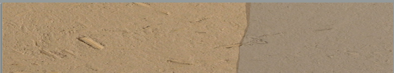
Marronnier + Kit Chanvre + Option cire